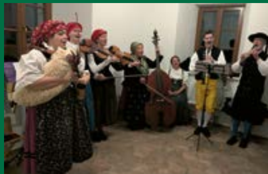
Rehberger Weihnacht, Seite 12