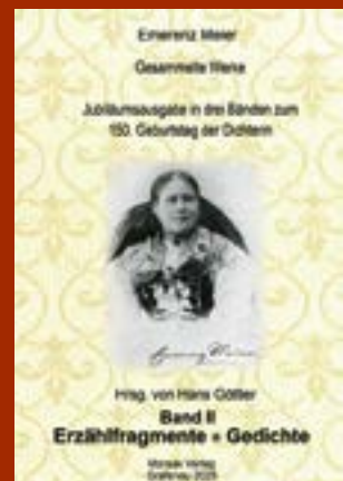
Emerenz Meier Jubiläumsausgabe Band II ISBN 978-3-86512-200-1 29,90 Euro