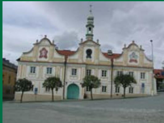
Bergreichenstein , Seite 10

Titelbild: Weihnachtskrippe Bergreichenstein Im Böhmerwald haben Weihnachtskrippen eine lange Tradition. Ausgeprägt ist dieser Brauch auch heute noch in Kašperské Hory/Bergreichenstein, wo diese Krippe im Rathaus gezeigt wird, das Foto zeigt einen Ausschnitt davon