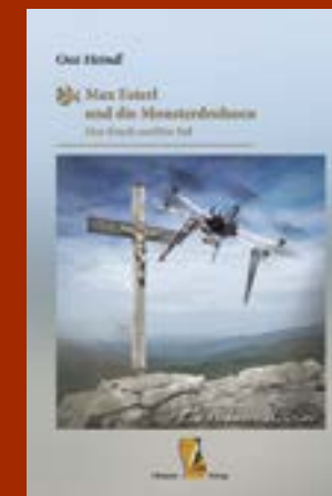
Ossi Heindl Max Esterl und die Monsterdrohnen 14,90 €