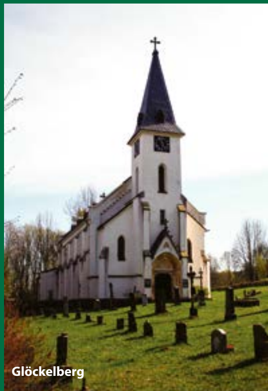
Verschwundene Orte im bayerisch-tschechischen Grenzgebiet, Seite 31